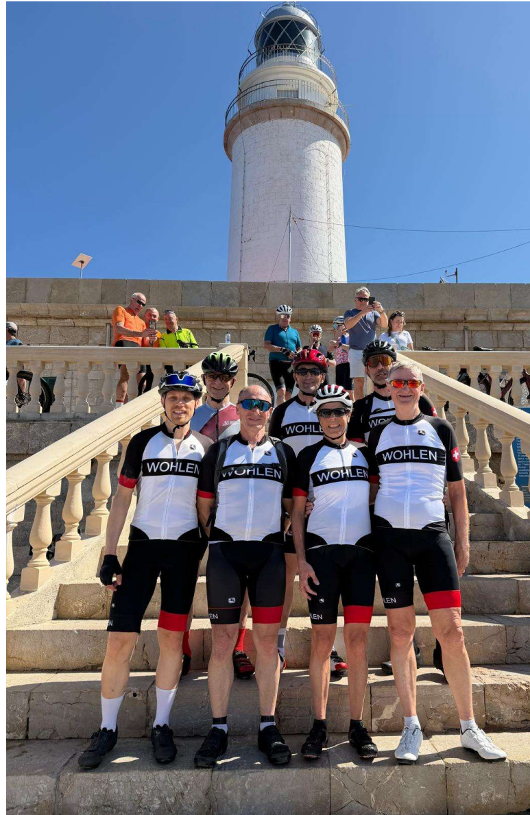
Gruppenfoto am Leuchtturm des Cap Formentor