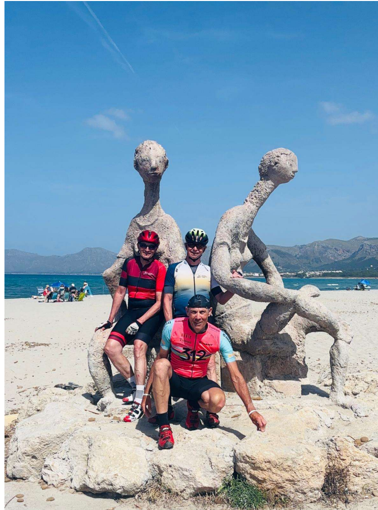
Gruppenfoto in Son Serra de Marina