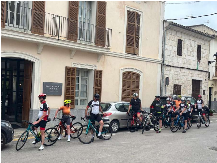
Warten in Muro, bis die Gruppe wieder versammelt ist

Je näher wir Muro kamen, desto mehr bestimmen landwirtschaftliche Flächen das Bild: Felder, alte Höfe und typisch mallorquinische Trockenmauern. Ein kurzer, aber knackiger Anstieg mit hübscher Aussicht zurück in Richtung Küste führte uns in die Altstadt. Weiter ging es nach Petra. Die Landschaft wird leicht hügelig, bleibt aber sanft und weitläufig. Petra wirkt fast wie aus der Zeit gefallen – warme Sandsteinfarben und eine entspannte, ländliche Atmosphäre prägen den Ort. Petra ist berühmt für seine Kaffees und den guten Mandelkuchen dort. Da es noch relativ früh war, legten wir keinen Halt ein. Eigentlich schade, für Kuchen ist immer Zeit. 😊