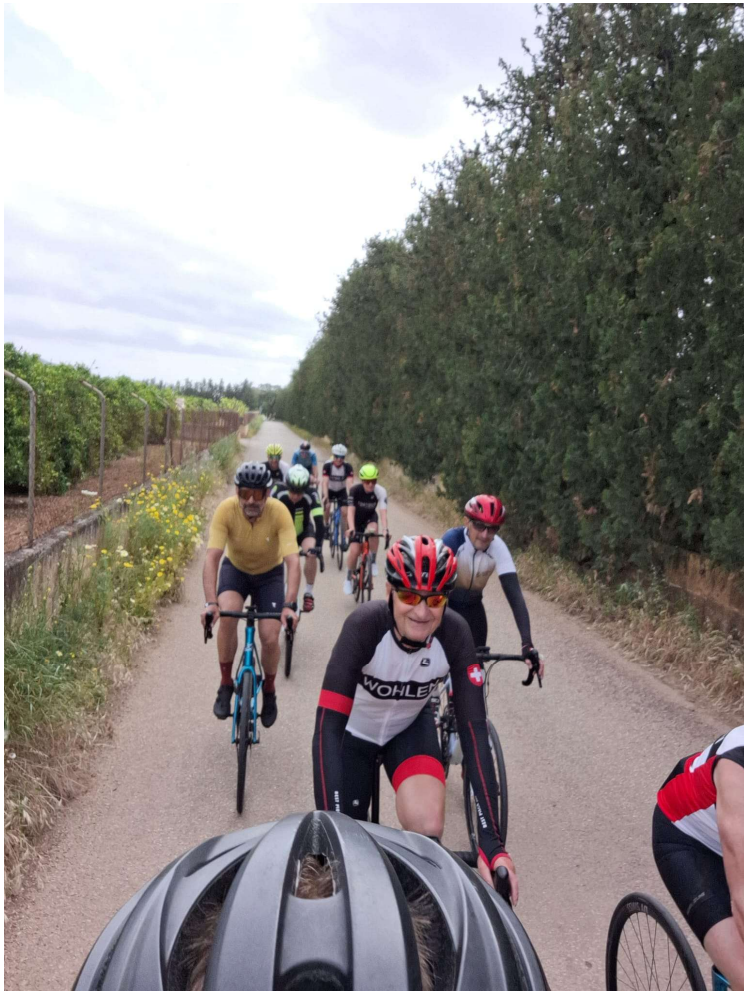
Unterwegs nach Bunyola an einer duftenden Orangenplantage vorbei

Der Anstieg zum Coll d'Honor und dem Örtchen Orient gehört zu den schönsten Abschnitten der Tour. Die neu asphaltierte Straße windet sich durch ein abgeschiedenes, grünes Tal. Dichte Wälder, alte Steinterrassen und sehr viele aktive Singvögel begleiten uns beim Aufstieg 🥰 Im Örtchen Orient stärken wir uns bei einem fast schon obligatorischen Kaffee und Kuchenhalt.