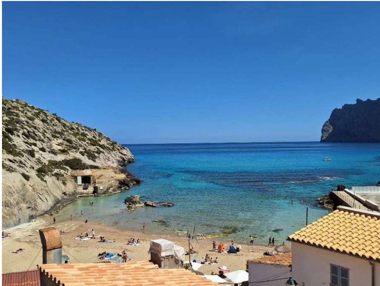
Bucht in Cala Sant Vicenç