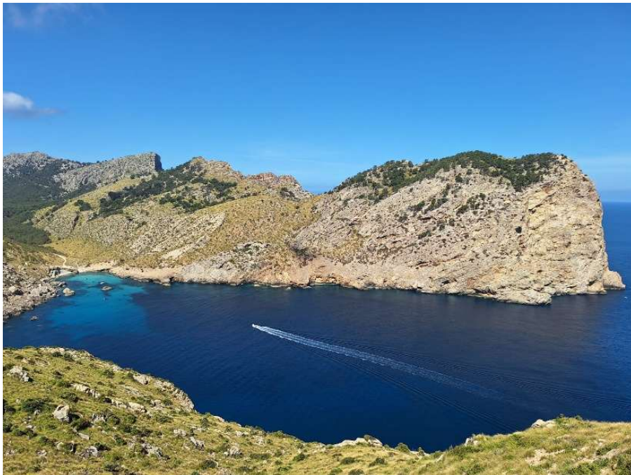
Wunderschöne Aussichten auf dem Weg zum Cap Formentor