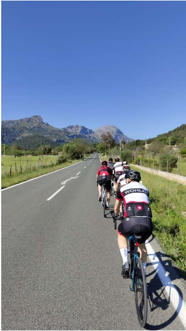
Leicht steigende Strasse zum Coll de Femenia