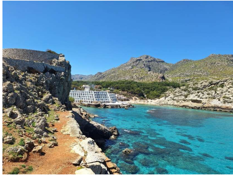
Unser neues Clubhaus 🎉