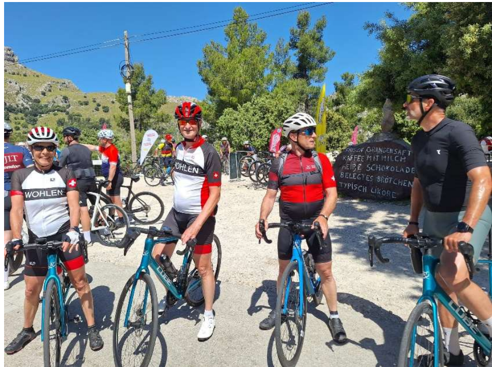
Gruppe beim Kiosk angekommen