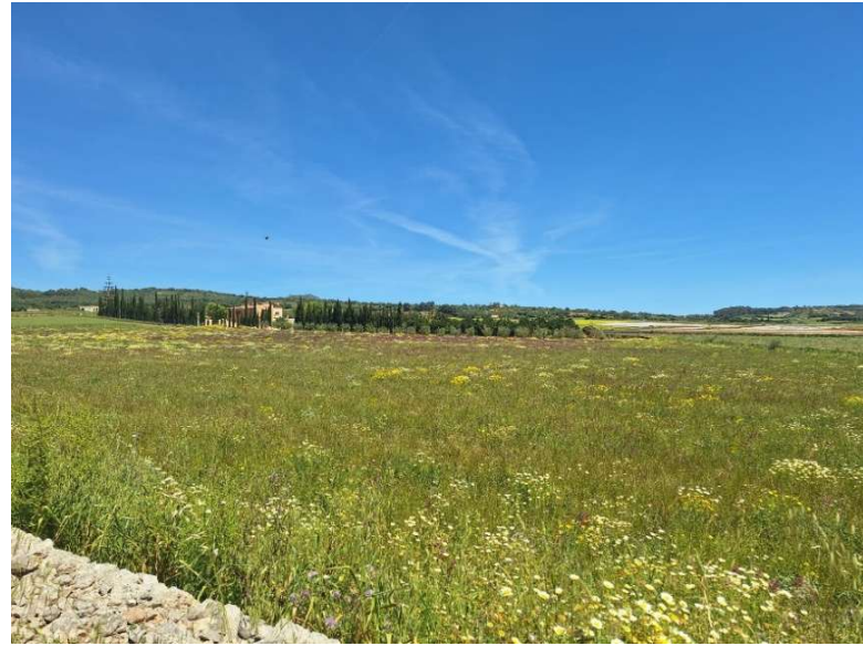
Aussicht auf dem Weg nach San Salvador