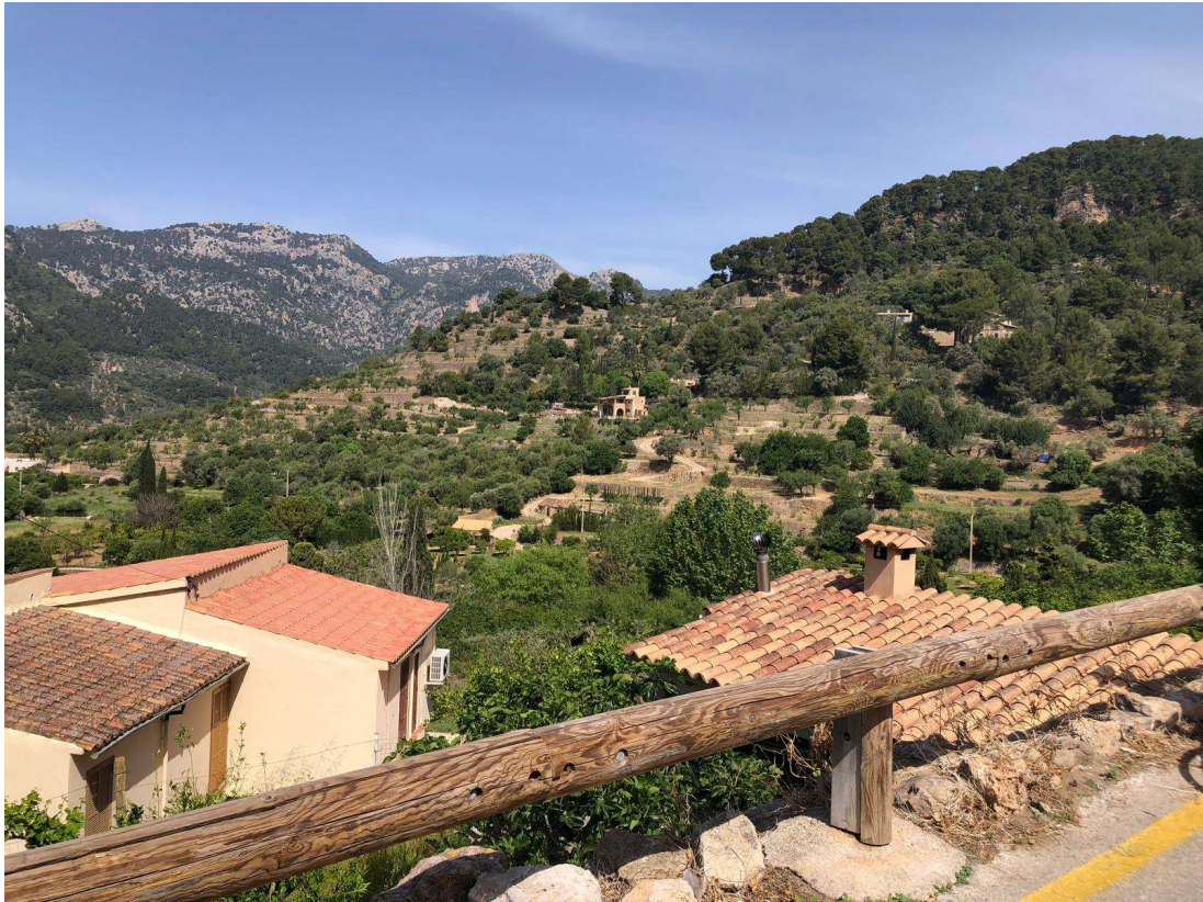
Aussicht im Aufstieg zum Coll d'Honor