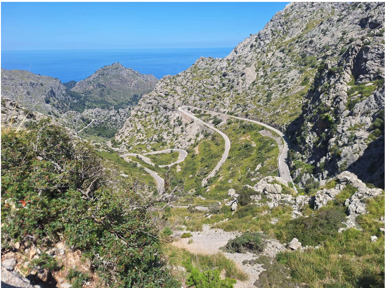
Spektakulärer Ausblick nach Sa Calobra in der Abfahrt vom Coll dels Reis

Die Abfahrt nach Sa Calobra ist ein echtes Highlight. In engen Serpentinien winden wir uns hinunter zum Meer. Unter uns öffnet sich eine gewaltige Schlucht, die im Meer endet. In der flüssigen Abfahrt ist jedoch Vorsicht geboten, da neben vielen Radfahrern auch Autos und die ganze Strasse benutzende Cars verkehren. Unten angekommen erwartete uns Sa Calobra mit seinem spektakulären Kontrast aus Felsen und Meer. Hier stärken wir uns in einem der vielen Kaffees für den Aufstieg, der mit 710 Höhenmeter auf 10 km sportlich herausfordernd ist.