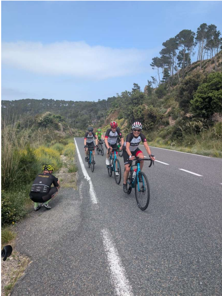
Mehr als ein Kameramann am werk 😊