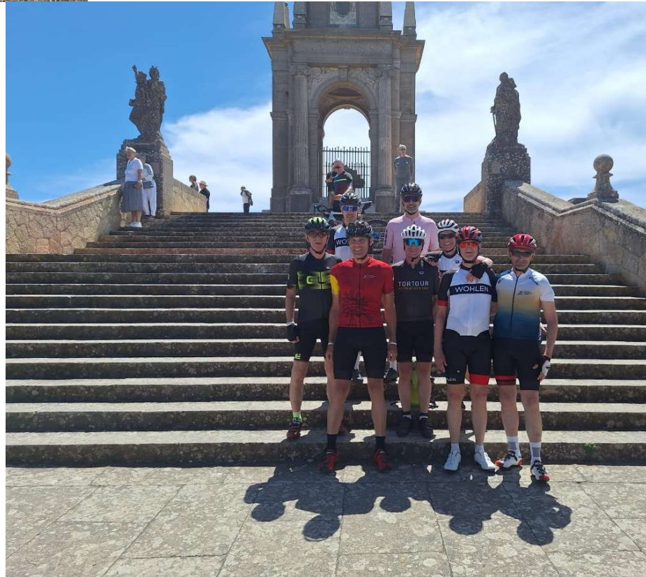
Gruppenfoto auf dem Gipfel des Sant Salvador