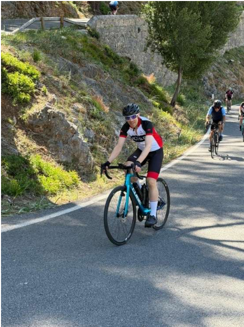
Ich im Aufstieg vom Sa Batalla (Tankstelle)