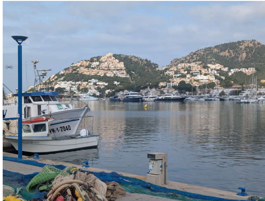
Der Hafen von Port d'Andratx