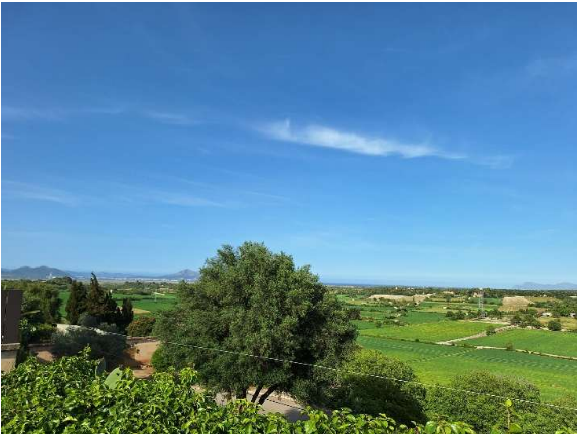
Ausblick von Muro in Richtung Küste