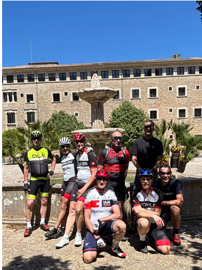
Alle wieder vereint für das Gruppenfoto vor dem Kloster Lluc

Anschließend ging es weiter Richtung Pollençà. Die Abfahrt ist flüssig und machte richtig Spaß. Obwohl eigentlich alle Höhenmeter des Tages hinter uns lagen, türmte sich vor uns dann doch noch ein unerwarteter Berg auf, nämlich der Berg der Holländer (der Gegenwind von der Küste 😊). Gestärkt durch die Kaffeepause und animiert von der langen, leicht abfallenden Strecke nach Pollençà nutzten wir den Moment für eine Trainingseinheit und drückten ordentlich in die Pedalen. Je näher wir Pollençà kamen, desto weiter öffnet sich die Landschaft wieder. Teilweise mit roten Köpfen, laufendem Schweiß und ziemlich ausser Atem (zumindest ich 🤦) besammelten wir uns beim ersten Kreiseln in Pollençà wieder. Der letzte Abschnitt führte uns zurück durch die Ebene. Nach den Bergen wirkte die Strecke angenehm flach. Wir passierten Felder, kleine Dörfer und genossen den weiten Blick Richtung Meer. In der Altstadt von Alcúdia stiessen wir auf die gelungene und anspruchsvolle Tour an. Wir hatten noch einen Gutschein für ein Bier beim Hürzeler Aperó. Dabei durften wir ein weiteres kleines Highlight feiern, nach der Präsentation des Reiseprogramms vom Hürzeler team gab es noch ein Kahoot-Quiz. Ich hatte aufgepasst und einen schnellen Daumen zum Auswählen der Antworten und belegte den ersten Platz 🏆. Der Preis war, naja ein Paar Rot/blau Hürzeler Socken, eine ziemlich aus der Mode gekommene Sonnenbrille und ein Hürzeler Pin 😊.