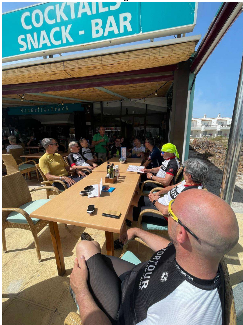
Tagesausklang an der Strandbar in Platja de Muro